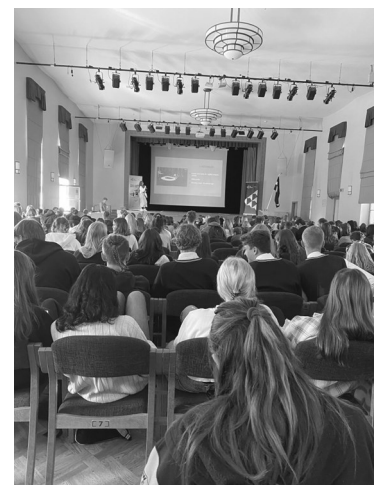
Viviāna Ribakova-Roledere (10.a)