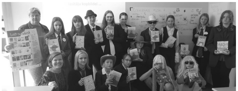
7.a klase - „Bērnu žūrijas 2023” dalībnieki

- Bibliotēkas darbinieces ir priecīgas, ja lasītavā skolēni starp sarunām, mājas darbu pildīšanu, darbu pie datora, atrod laiku arī galda spēlēm. Varbūt pienācis laiks noorganizēt kādu galda spēļu turnīru... ?